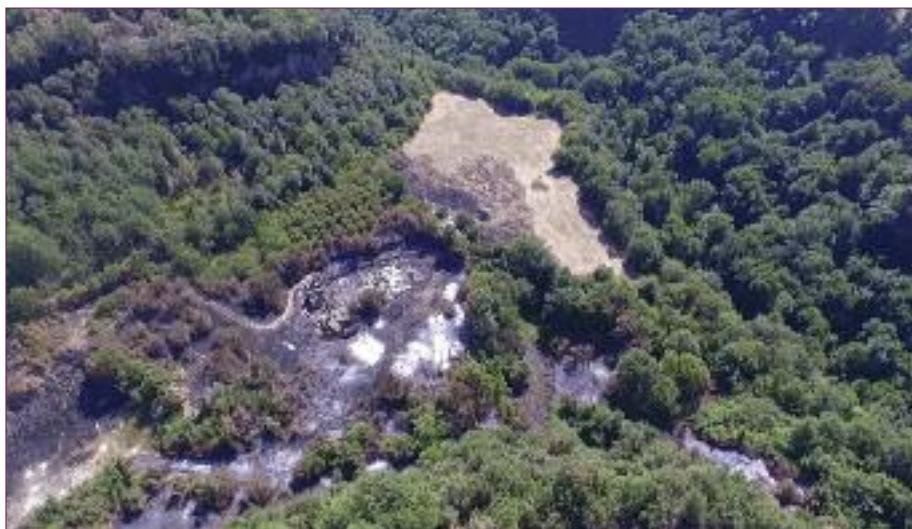
La fornace di Mazzano dopo l'incendio

La siccità ha influito considerevolmente al numero e alla vastità degli incendi che hanno segnato questa stagione . Se la causa scatenante è quasi sempre l'uomo che con dolo o per disattenzione dà inizio alle fiamme, il terreno e la vegetazione secchi ne favoriscono la propagazione, determinando le devastazioni cui abbiamo assistito. Negli ultimi venti anni non avevamo mai registrato tanti eventi nel terri-