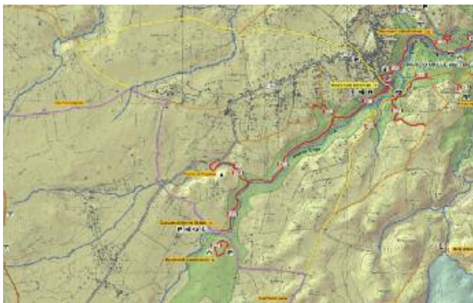
In giallo la variante della via Francigena che passa nel paese di Mazzano

Durante la scorsa edizione, nel settembre 2016, il Parco ha ospitato nel Palazzo Baronale di Calcata giornalisti di varie nazioni che stavano percorrendo la via Francigena, per promuovere la messa in rete dei Cammini italiani.