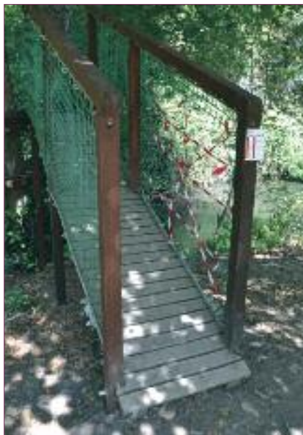
Il ponte recentemente danneggiato

e sentieri, sporca o rende impraticabili luoghi che appartengono alla collettività. Per tutelare il parco stiamo valutando la possibilità di realizzare un sistema di videosorveglianza delle aree più a rischio. Noi faremo la nostra parte ma è la sensibilità individuale di ciascuno di noi che può fare la differenza.