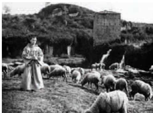
Monte Gelato, 1950, in un fotogramma del film di Roberto Rossellini Francesco, giullare di Dio

di Maciste. Dalle commedie con Franco e Ciccio , ai film del celeberrimo Trinità ,