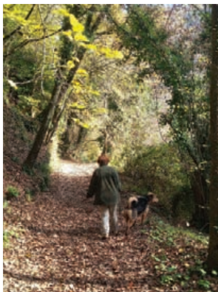
Una passeggiata nelle forre del Treja

nelle aree archeologiche, alla ricerca delle bellezze più apprezzate del territorio del Parco.