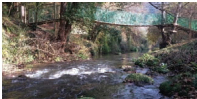
Un ponte da attraversare in fila indiana

Uno degli ultimi interventi costruttivi del Parco del Treja è la realizzazione di un ponte tibetano , in località Le Rote , nel comune di Mazzano Romano. Siamo a pochi passi dal confine di provincia ,