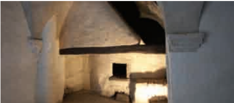
L'antico forno pubblico dei calcatesi

ai primi decenni dell'anno mille . Nel corso di un millennio ha subito vari rimaneggiamenti e sovrapposizioni. Dopo una fase di abbandono del recente passato,