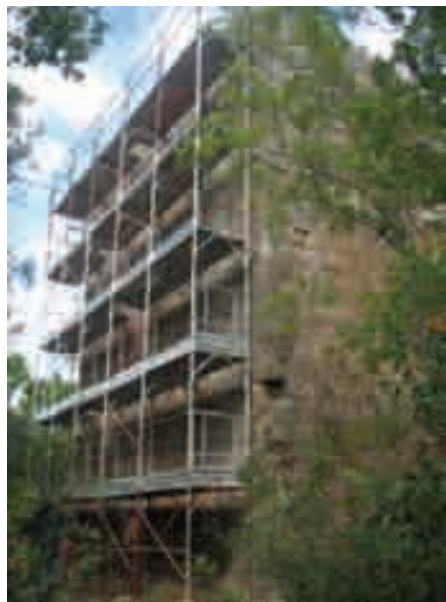
Le prime fasi del cantiere

A nche in questo caso sono stati utilizzati finanziamenti regionali, prove-