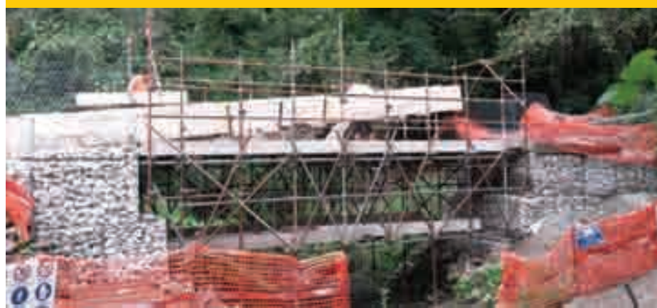
La costruzione del ponte sul torrente Rio

Il ponte si presenta molto alto sul livello del torrente, questo è dovuto a motivi di sicurezza , in quanto la sua altezza, per legge, deve superare di un paio di metri il livello della massima piena verificatasi negli ultimi duecento anni.