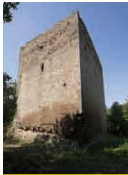
La torre restaurata

è provveduto inoltre alla messa in sicurezza dei percorsi e alla sistemazione dell'area circostante. Un'area particolarmente panoramica, da cui si gode una straordi-