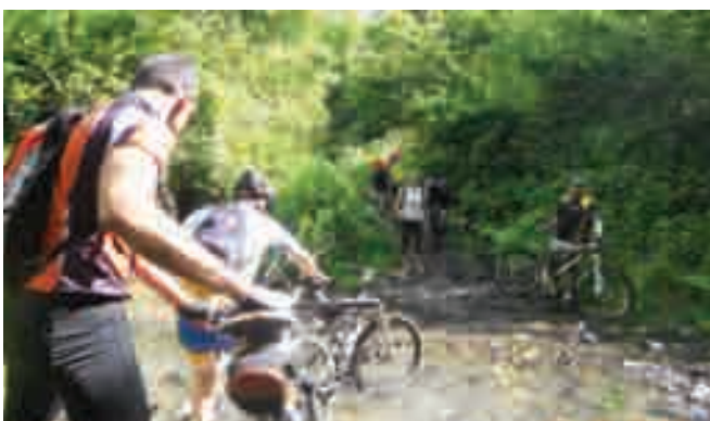
Un guado lungo il percorso presso la Mola di Magliano

mi. Da Calcata si attraversa il fiume Treja in direzione di Mazzano Romano. Il borgo merita una visita , anch'esso come Calcata è costruito su uno sperone tufaceo a picco sul Treja.