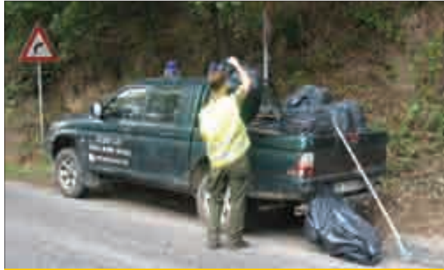
Durante la bonifica sono stati raccolti alcuni quintali di rifiuti

zioni pubbliche preposte alla pulizia, ma soprattutto di quella dei cittadini, che attraverso campagne di educazione ambien-