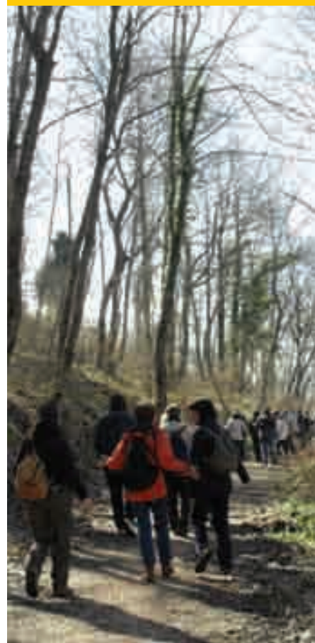
Un gruppo di escursionisti

segnato a camminare. Poi però siamo stati generalmente destinati ai mezzi a motore, così disimpariamo a camminare. Camminare fa bene alla salute, alla mente e al cuore. Ci si ritrova in forma senza fatica e senza spendere soldi. È un'attività che può essere molto socializzante se fatta insieme ad altre persone. Nel Parco della Valle del Treja, camminando, si possono scoprire valli e colline, acque, boschi e cascate. Qua e là occhieggiano borghi tra il verde degli alberi. Le case di tufo sembrano il prolungamento naturale delle rupi sottostanti. Le nebbioline del mattino o dei giorni di pioggia avvolgono le valli, mentre l'ocra delle rocce si scalda con i colori del tramonto. Domenica 11 ottobre, nell'ambito del programma annuale delle visite guidate del Parco è prevista un'escursione lungo il fiume Treja, dedicata ai bambini.