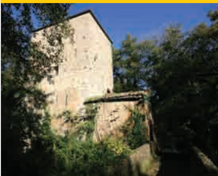
La Mola di Monte Gelato

La suggestione dei luoghi lo rendono una meta classica per gite e scampagnate.