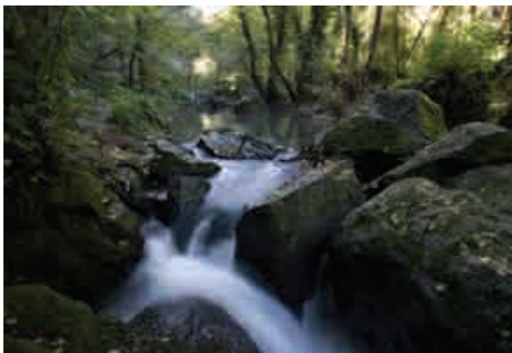
Le cascatelle del fiume Treja

Le sorgenti del Treja sono localizzate pres-