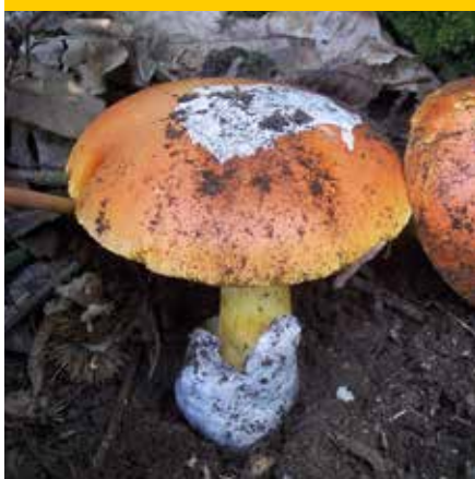
Amanita Caesarea - Ovulo buono

Stampa Tipografia Vallelunga di Campagnano di Roma