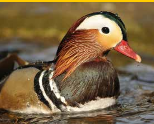
Anatra mandarina

flora, fauna e ancora i borghi, le montagne, fiumi e laghi... Il programma prevede passeggiate alla ricerca di scorci, immagini, dettagli da fotografare e da analizzare successivamente, durante gli incontri in aula. I temi del programma saranno gli animali , l' acqua e il paesaggio , con una speciale sessione dedicata al paesaggio notturno . Per iscrizioni o informazioni scrivere a corsofotografia@parcotreja.it o telefonare al parco del Treja, 0761 587617. La partecipazione al corso costa 40 euro . Il versamento può essere effettuato il primo giorno del corso stesso.