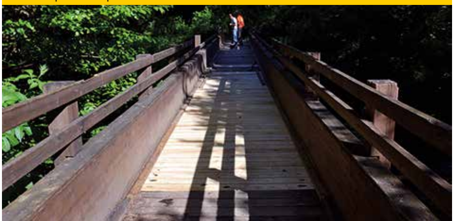
Lavori di ripristino del ponte

che nei mesi scorsi aveva subito ingenti danni ed era diventato pericoloso da percorrere. Si erano infatti danneggiate alcune assi del tavolato del piano di calpestio. I lavori di ripristino sono stati realizzati dal Parco, per consentire durante la stagione di maggior afflusso di turisti, la piena fruizione dei percorsi. In questo modo è stato messo in sicurezza un anello tra i più facili e conosciuti, tra i percorsi dell'area protetta. Un sentiero frequentato soprattutto dalle scolaresche che vengono a scoprire i segreti del fiume e la bellezza del paesaggio.