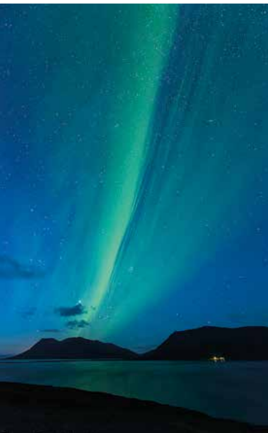
Aurora boreale