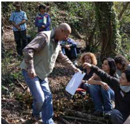
Visita guidata al Treja

A settembre riprendono le visite guidate. Il Parco, in collaborazione con alcune associazioni, ha predisposto un calendario di escursioni che ogni fine settimana ci porteranno nei luoghi più interessanti e affascinanti della valle del Treja. Passeggiando lungo i ruscelli, entreremo nei boschi in punta di piedi e risaliremo le forre alla scoperta di alcune tombe falliche.