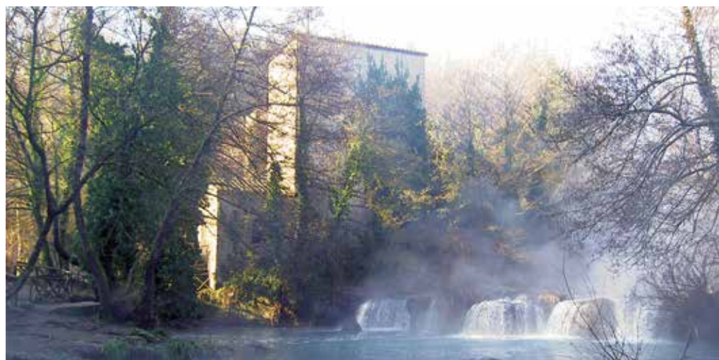
La Mola di Monte Gelato

Se il progetto sarà finanziato, la mola potrebbe tornare ad essere un centro produttivo, dal grano all'energia elettrica, la forza dell'acqua non fa differenza!