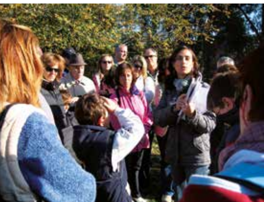
Una visita guidata