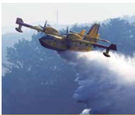
Un Canadair in azione

La sorveglianza e una stagione piovosa hanno aiutato a prevenire gli incendi